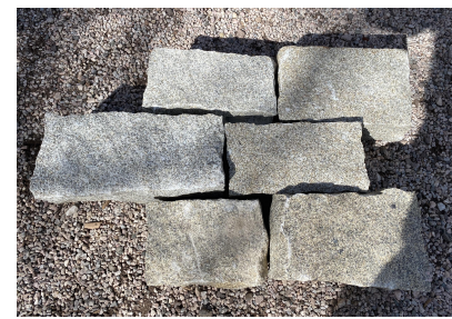
HRANOLY ŠTÍPANÉ, ŽULOVÉ, ŠÍŘKA 10 cm, VÝŠKA 10 cm, DÉLKA PROMĚNNÁ BUDE PROVEDENO NA ZÁKLADĚ VZORKU POLOŽENÉ DLAŽBY, KTERÝ ODSOUHLASÍ AD.